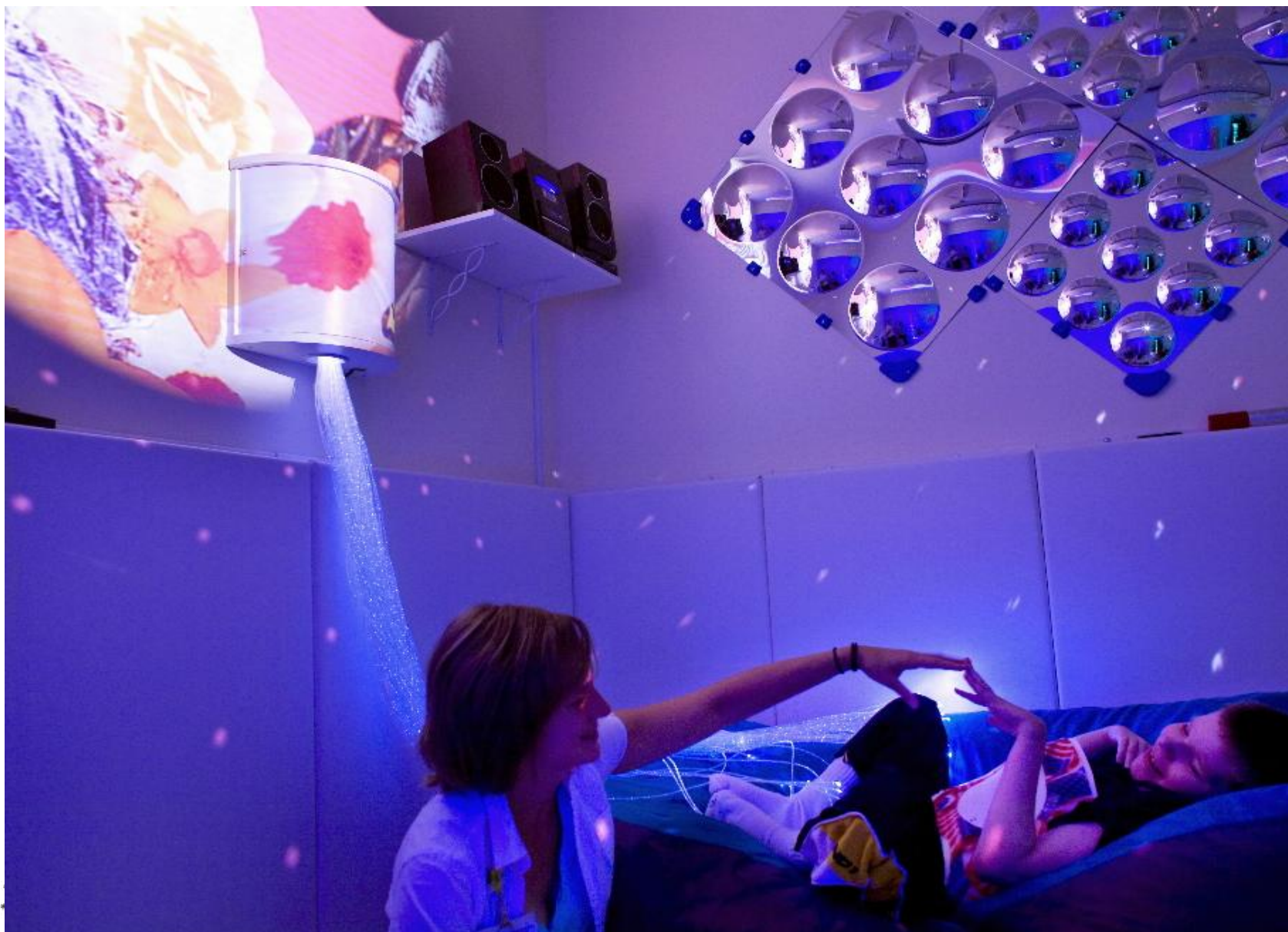
Equipe Ressource Régionale Soins Palliatifs Pédiatriques